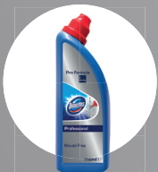
DOMESTOS NETTOYANT JOINTS